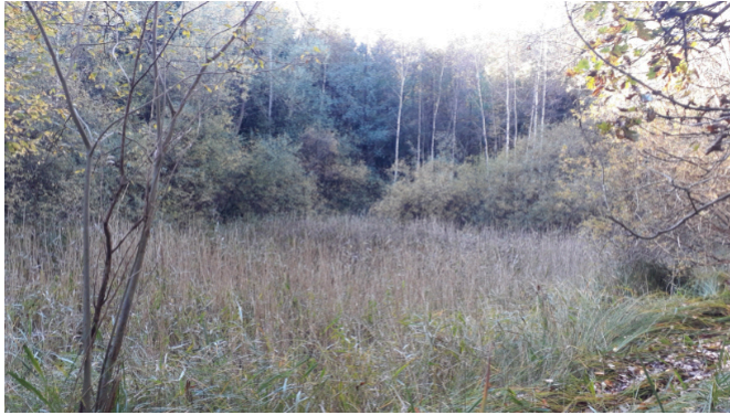
Der kleinere Müllbergteich