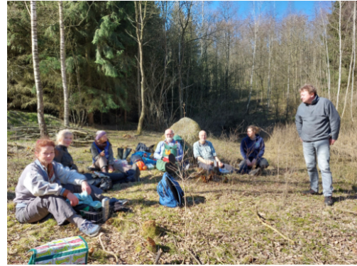
Picknick auf der freien Uferfläche